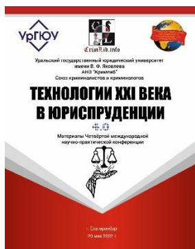
Сборник конференции 2022 г.

Доклады принимаются до 23:59 (GMT+5) 13 мая 2023 года.